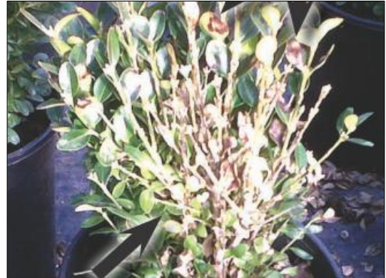
Fig. 7, 8 – Sintomi fogliari causati dal fungo Cylindrocladium buxicola su piante di bosso: disseccamento e defogliazione a seguito della malattia.