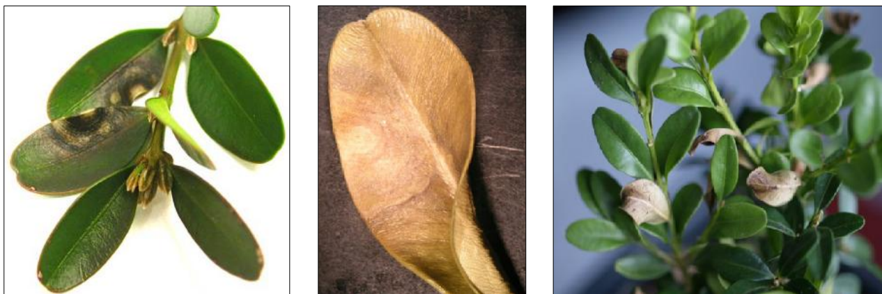
Fig.1, 2, 3 – Sintomi fogliari causati dal fungo Cylindrocladium buxicola su piante di bosso: caratteristiche macchie fogliari rotondeggianti, disseccamento e caduta anticipata.

La malattia è diffusa nei paesi Nord Europei ed è in espansione: il primo ritrovamento è del patogeno risale al 1994 nel Regno Unito, successivamente è stato rinvenuto anche in Nuova Zelanda nel 1998, in Belgio nel 2001, in Irlanda, Olanda e Germania nel 2005; In Italia il patogeno è stato segnalato per la prima volta nel 2007 in giardini e vivai della Lombardia nelle province di Como e Varese. L'origine geografica del patogeno è tuttora sconosciuta; recenti studi genetici ipotizzano che esso possa avere origine esotica o essere il frutto di una ibridazione di ceppi patogeni provenienti da zone isolate geograficamente.