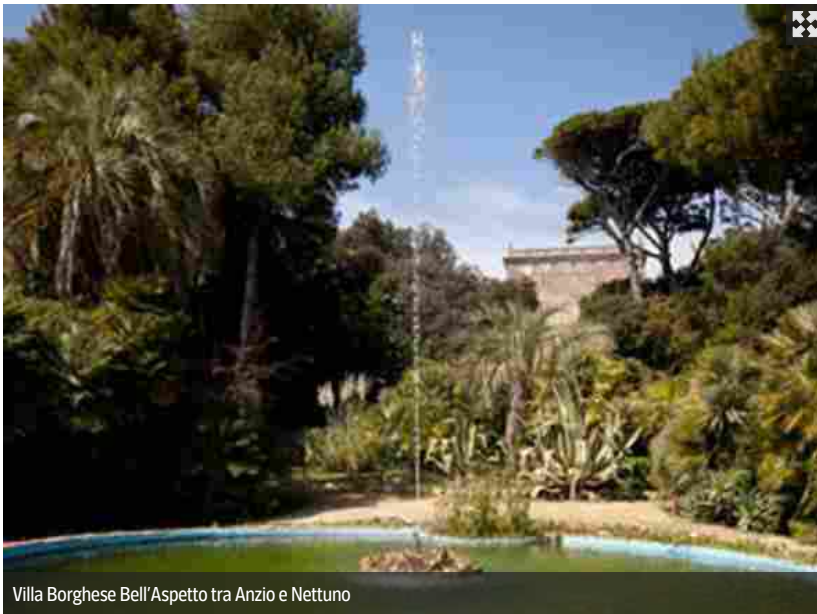
Villa Borghese Bell'Aspetto tra Anzio e Nettuno

Un cono di luce sul verde e uno spicchio di bellezza svelato. Il 2 e 3 giugno saranno aperti al pubblico per le visite guidate e le feste la spettacolare Villa Borghese Bell'aspetto tra Anzio e Nettuno, Villa Gregoriana e Villa D'Este a Tivoli, il Giardino di Ninfa a Cisterna di Latina. Tra le ville italiane che hanno aderito all'iniziativa «Incontriamoci in giardino» ci sono anche il Castello Ruspoli a Vignanello e il relais Villa Tirrena a Vaiano (entrambi in provincia di Viterbo), Villa Mergè a Frascati, Opera Bosco a Calcata e i Giardini di Confucio all'Esquilino.