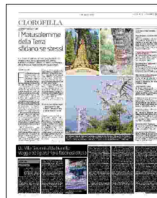
il giardino di casa Lajolo a Piosasco