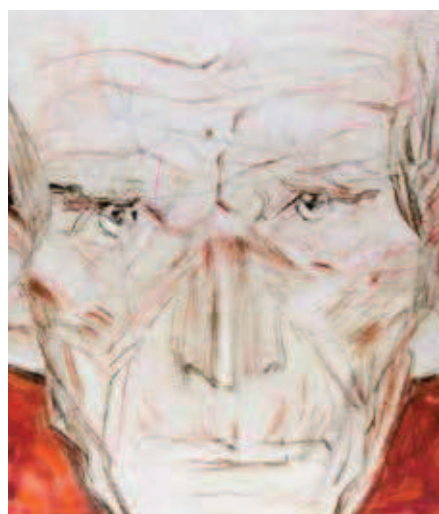
Tullio Pericoli, Samuel Beckett (2013)